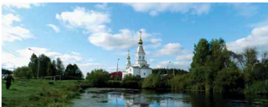
Храм Александра Невского в пос. Балтым

Доехали до границы села Мостовское (с 1724 года – конная почтовая станция) и пешим порядком дошли до храма святого благоверного князя Александра Невского, превращённого в клуб, средоточие культурной жизни села. Действуют детские кружки – квиллинг, энкаустика. Сдвинув несколько столов на сцене, ставим на них принесённые нами иконы: Божией Матери, Симеона Вер-