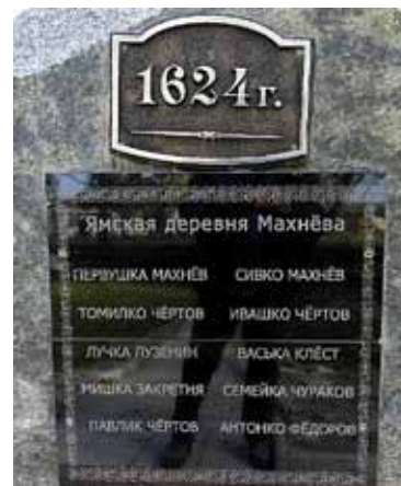
▲ Памятник ямщикам в пос. Махнево