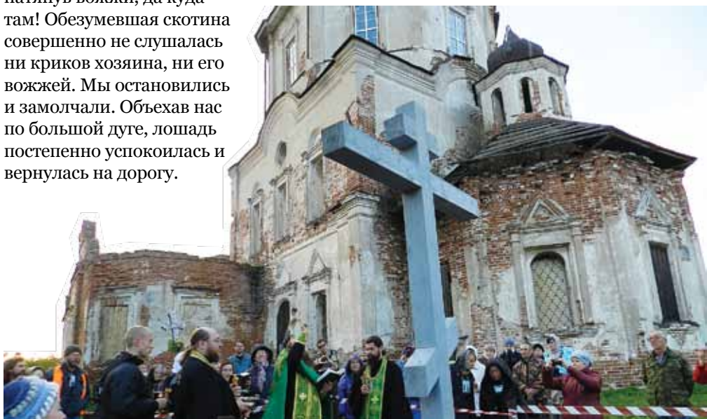
Поклонный крест в Коптелово >