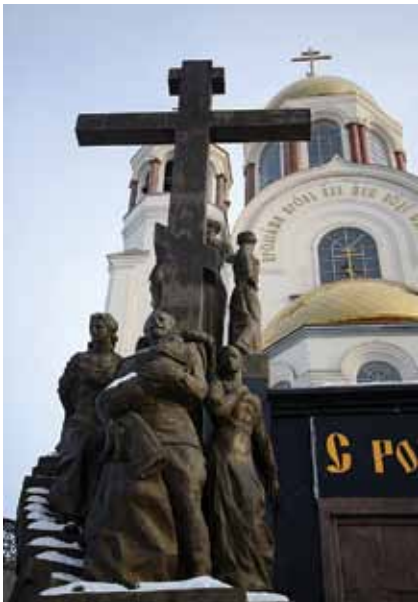
▲ Памятник святым Царственным Страстотерпцам у Храма-на-Крови

людей там бывало. И я каждый день ходил полюбоваться, посмотреть на свою работу – не ускакали мой легендарный маршал на бронзовом коне. Не верилось, что сделал сам. Не верилось. И один раз я был свидетелем любопытной сцены. Пожилой человек у памятника стоял, примерно моего возраста или постарше, и с ним рядом был, видимо, внук его, лет 5-ти мальчишечка. А вокруг монумента барельефы сделаны, барельефы русского оружия: там и секиры, и топоры, и мечи, и всё это распределено по отрезкам времени. И вот ребёнок спрашивает: «Это что за шапка такая высокая, длинная?» А дед ему отвечает: «Это кивер». И рассказал ему немного по истории. «А это что такое?» – «Это кольчуга, которую надевали наши русские воины. Князь Игорь и Ольга на тризне сидят, дружина пирует у берега», – и так далее. «А это что?» – «А это пулемёт Максим, который был во время войны». Короче говоря, дед, обойдя памятник, рассказал через эти фрагменты историю нашего государства. Вкратце, но очень доходчиво для ребёнка – и это, я думаю, ребёнок запомнил на всю жизнь.