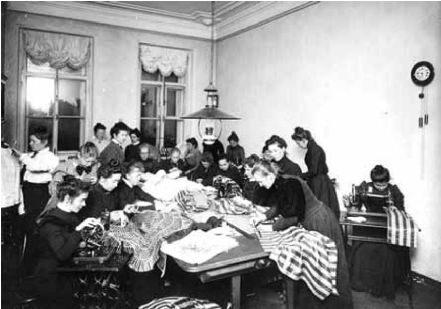
▲ Санкт-Петербургский дом трудолюбия

В 1816 году Патриотическое общество расширило свои благотворительные функции за счёт оказания помощи престарелым, увечным, вдовам и сиротам бедных людей, вступивших в ополчение. Для детей, не имевших пристанища, были созданы частные школы, также называвшиеся патриотическими. Одним из результатов деятельности Патриотического общества явилось открытие сиротского училища для воспитания дочерей погибших на войне штаб- и обер-офицеров. По уровню постановки педагогического процесса это училище очень скоро встало в один ряд со старейшими учебно-воспитательными учреждениями; в 1822 году оно получило название Патриотического института.