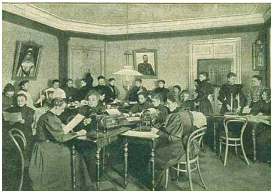
▲ Дом трудолюбия для образованных женщин в Санкт-Петербурге

Указом от 29 декабря 1812 года Елизавета Алексеевна учредила женское Патриотическое общество для «вспомоществования бедным, от войны пострадавшим», ставшее старейшей и наиболее влиятельной в России женской общественной организацией. Общество ставило перед собой задачи оказания материальной помощи разорённым войной, содействия госпитализации больных, устройства детей бедных родителей в училища, предоставления нуждающимся жилья и помощи в обучении.