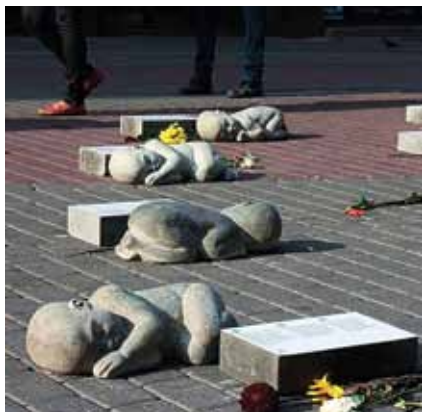
▲ Памятник нерожденным детям в Риге

отвечаем на них, с одной бабушкой ведём настоящую переписку.