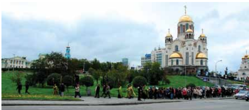
Храм-на-Крови. Начало пути

Погода не балует – холодно, пасмурно и ветер. Прямо на стройплощадке служим краткий молебен и идём до пересечения улиц Восточная – Челюскинцев. Там, к моему сильному удивле-