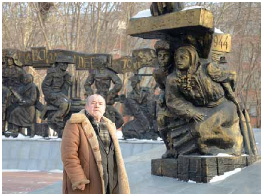
▲ Памятник детям – труженикам тыла

Я всё время ждал какого-нибудь знака – ведь делаю памятник страстотерпцам, святым делаю – ну, хоть воробей или голубь залетел бы, ну, хоть