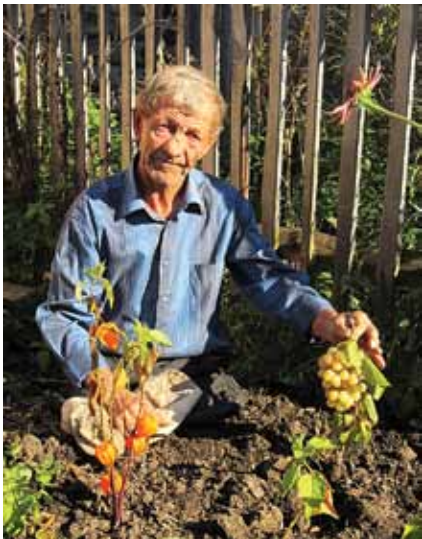
Уральский виноград на улице Мира