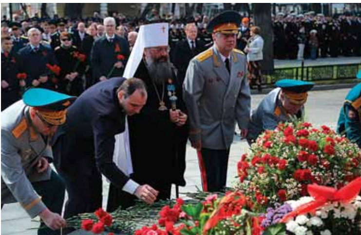
▲ Георгию на коне — цветы, благодарность и память

Это был первый памятник, который освятила Церковь. Помню, на открытие пришло много народу, яблоку упасть негде было. Когда только памятник открыли (8 мая 1995 года - прим. ред.), много