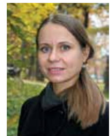
Статью подготовила Юлия Комлева, кандидат исторических наук

ности служила её набожность, возвышенная, просвещённая и превосходящая все мечтания. Эта чистая, непорочная душа возвышалась беспрепятственно к Превысшей Воле, где почерпала свою силу и свой душевный покой. Строгая к самой себе, снисходительная к ближним, Императрица выражала делом то, что другие выражают на словах».