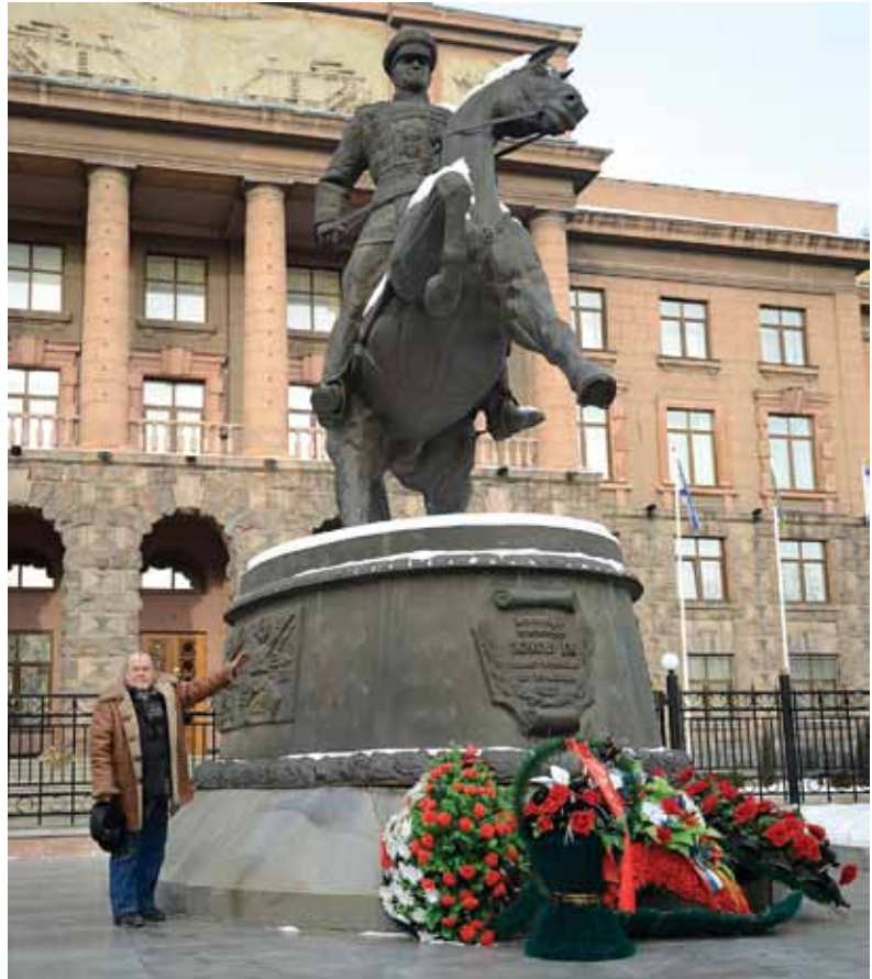
▲ Памятник маршалу Жукову