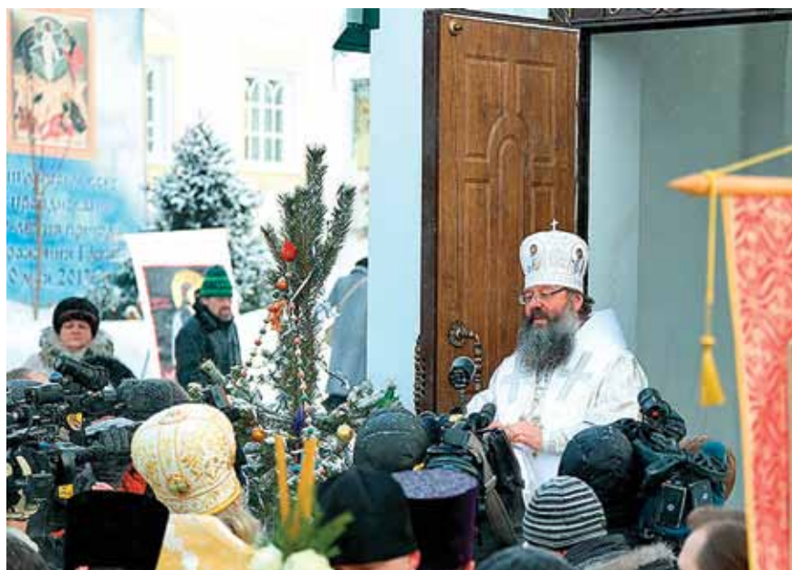
▲ 11 января 2012 года, в день памяти Вифлеемских мучеников, митрополит Екатеринбургский и Верхотурский Кирилл совершил чин освящения часовни в честь 14000 младенцев, от Ирода в Вифлееме избитых.

■ Памятник нерожденным детям в Риге состоит из 27 скульптур в виде младенцев. Возле каждого малыша есть небольшой постамент, на котором на трех языках (русском, английском и латышском) написано 27 историй, точнее – причин, из-за которых мамы этих малышек решились на аборт.