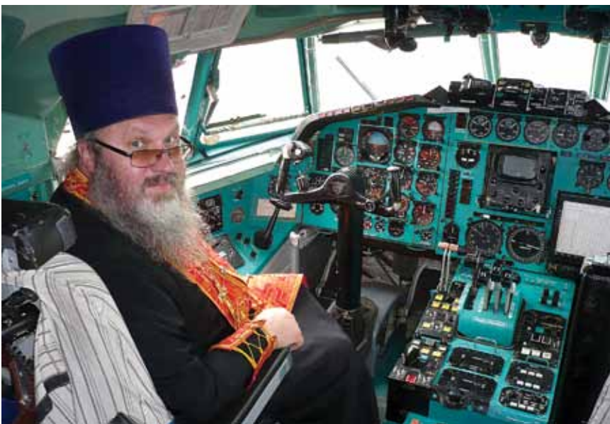
Настоятель храма – это пилот + штурман

Во время войны 1853-1855 годов молитвами перед этой сильной иконой был защищен город Одесса от вторжения захватчиков. В то тяжелое время святыню с крестным ходом принесли из села Касперовка в Одессу, и она осталась нетронутой. На постоянном месте пребывания икона находится всего около четырех месяцев, в остальное время она путешествует по южным городам Украины, давая возможность простым верующим ощутить всю ее безграничную благодать.