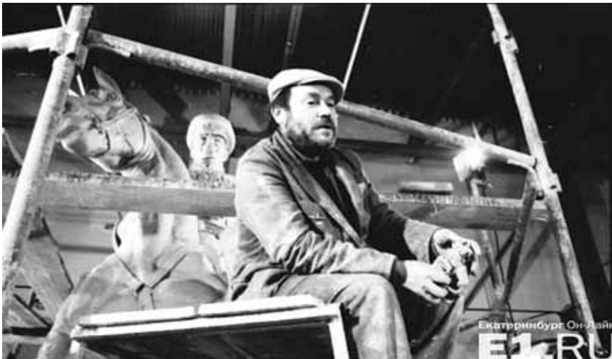
Архивное фото (источник – портал E1.ru)

дом, областью, государством – а вы постарайтесь сделать то, что надо нам, солдатам, которые там воевали, служили. То, что нужно нам». А что такое – «нам»? И что такое – «вам нравится»? Вот, как говорят: «Тут образ не тот». А какой – тот?! И никто не знает. И художник ищет, какой он – «тот» образ.