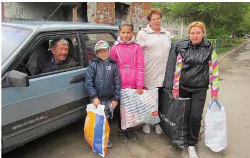
Семья Южаковых с внучатами

Ксения Кабанова