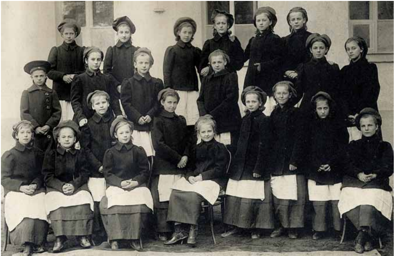
▲ Воспитанницы Санкт-Петербургского Елизаветинского института

громко произнесла Символ веры. Она была хороша собою, как ангел, одета в розовое платье, вышитое большими белыми розами, с белой юбкой, вышитой таким же образом розовыми цветами; ни одного бриллианта в распущенных русых волосах. Это была Психея!.. Принцесса была наречена именем Елисаветы, в память императрицы, избравшей Екатерину». Сама Екатерина II писала барону Гримму: «Эта пара прекрасна, как ясный день, в ней пропасть очарования и ума... Это сама Психея, соединившаяся с любовью».