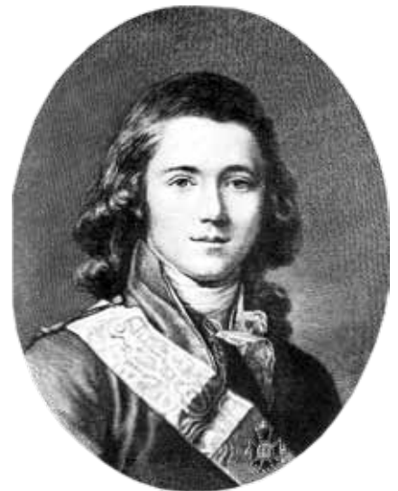
▲ Портрет Великого Князя Александра Павловича

Немецкая принцесса Луиза-Мария-Августа Баден-Дурлахская в возрасте 11-ти лет приехала в Россию по приглашению Императрицы Екатерины II. Когда ей исполнилось 14 лет, её выдали замуж за 16-летнего Великого Князя Александра Павловича, будущего Императора Александра I. Один из придворных, граф Федор Головкин, описал церемонию обращения Луизы в Православие: «Принцесса посреди дворцовой церкви