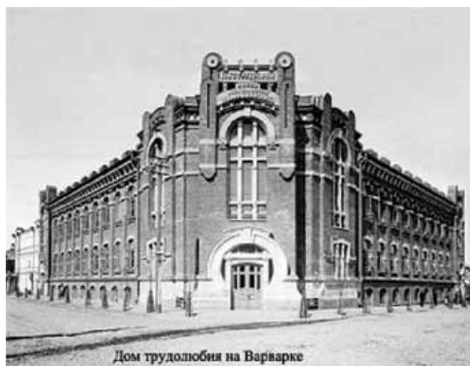
▲ Московский дом трудолюбия