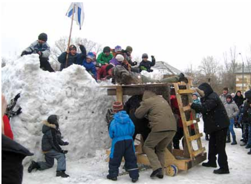
Богатырская застава рядом с храмом для больших и маленьких

Собираем вещи для дома ребенка в поселке Вьюхино и для нуждающихся. Планируем построить новое здание для церков-