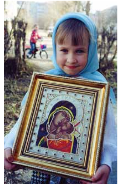
Первая Касперовская икона Кольцовского храма