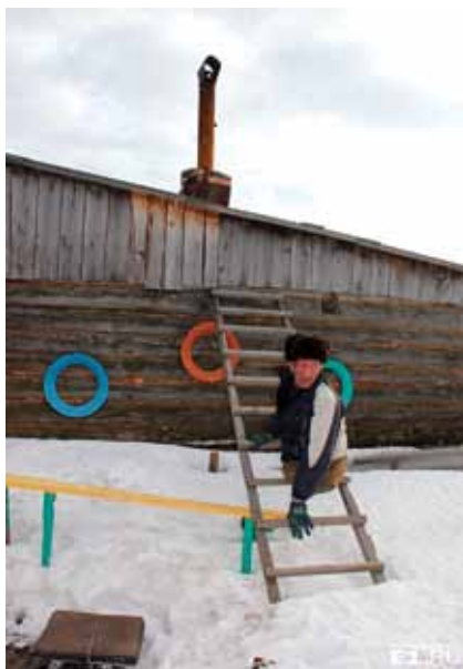
^ Все в доме - своими руками

«Я всегда работал и с трудностями справлялся сам, всегда считал и считаю, что всё в моих руках! И сейчас не сижу сложа руки – несколько лет назад взял в кредит машину (ВАЗ 2109), переоборудовал под ручное управление и подрабатываю таксистом. Летом на трассе продаю грибы и ягоды, сам содержу и обихаживаю огород, по дому всю работу также делаю самостоятельно. Нам, старикам, мало надо – был бы свой угол, да чтобы у внуков