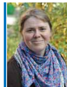
Автор Ксения Кабанова Фото из архива Евгения Бунтова