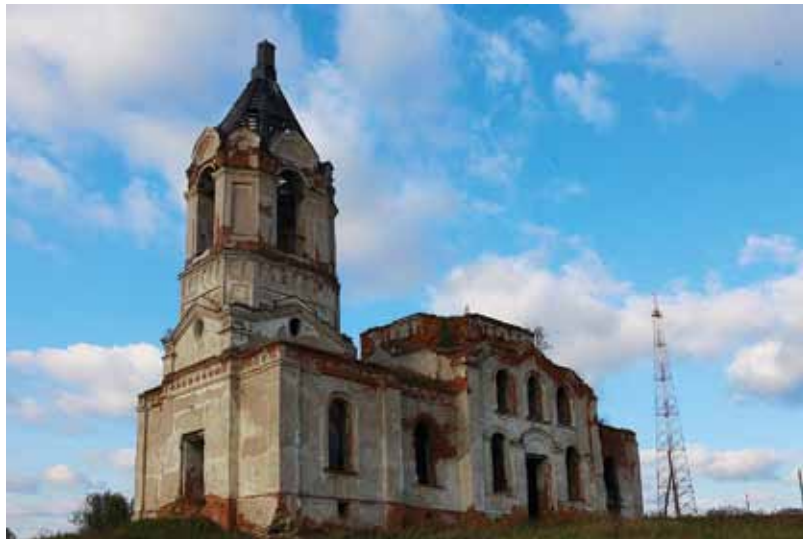
Храм Рождества Богородицы в с. Комарово