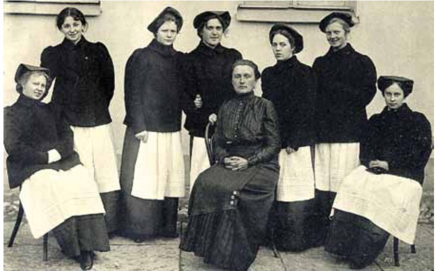
Санкт-Петербургский Елизаветинский Институт. 1913-1914, педагогический класс

Ей недоступны были наслаждения удовлетворённой гордости; Императрица попирала ногами блеск житейской суеты и отказалась бы от всего для удовлетворения жгучей потребности творить добро. [...] Источником её деятельной благотворитель-