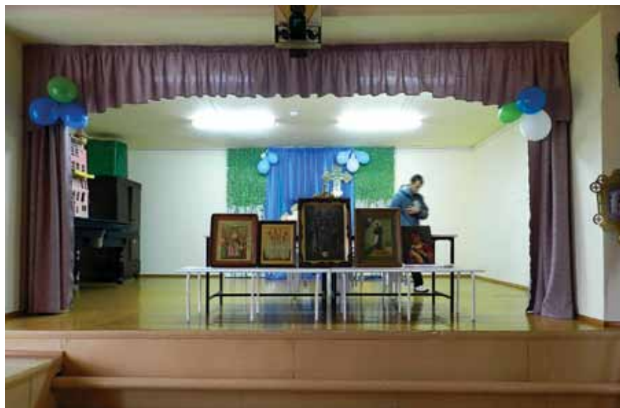
Импровизированный иконостас в клубе с. Мостовское. Бывший храм Александра Невского