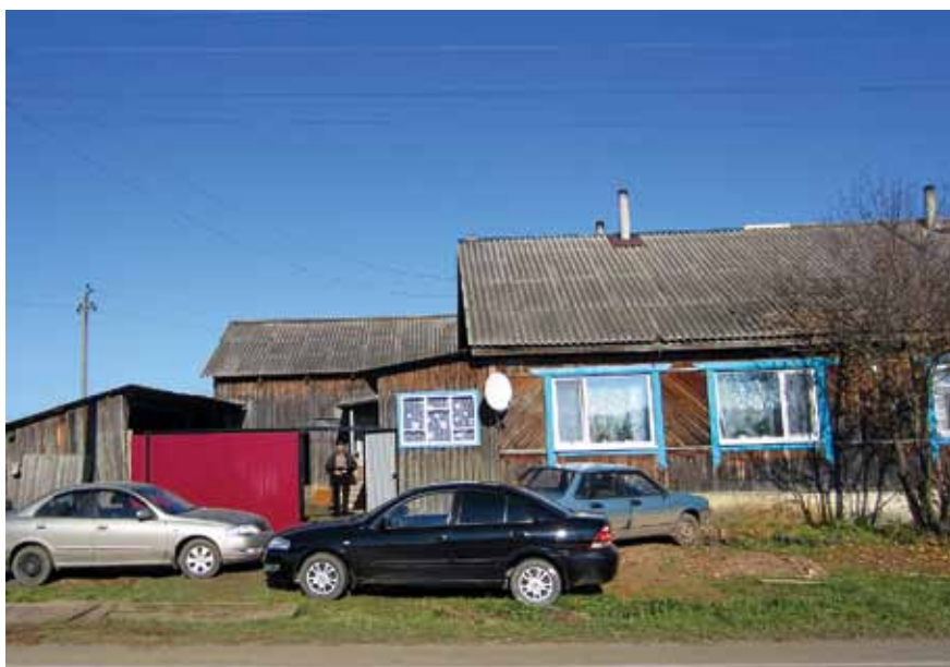
^ Добро пожаловать в новый дом!

Сначала всё шло к тому, чтобы всё-таки выкупить дом, из